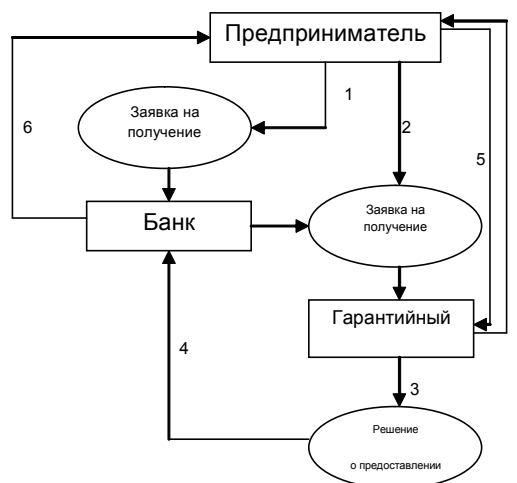
Рис. 3. Схема реализации механизма кредитных гарантий

2. Банк принимает решение о финансировании и, по согласованию с СМСП, подает заявку на предоставление поручительства (прилагается выписка из решения кредитного комитета банка).