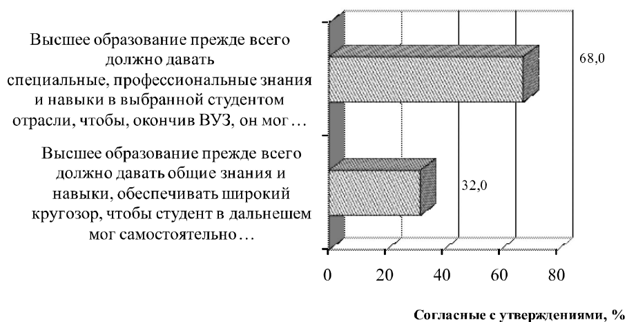
Рис. 1. Распределение населения относительно подходов прагматизации и гуманитаризации (диаграмма составлена автором на основе данных работы [9])

Как показывают исследования, у более образованных людей больше шансов найти работу и, если они экономически активны, меньше шансов остаться безработным. Однако помимо образования для благополучия человека необходимы такие факторы, как обладание правами человека и гражданскими свободами, хорошее состояние здоровья, чистая окружающая среда и личная безопасность.