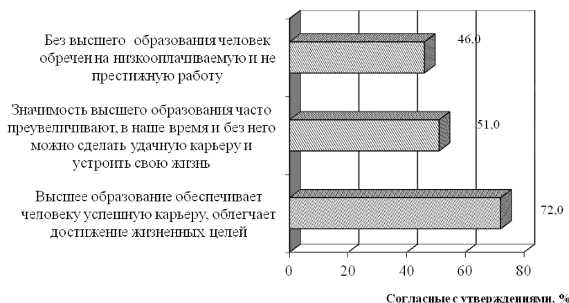
Рис. 3. Согласие респондентов с указанными высказываниями, в %, 2011 год (диаграмма составлена автором на основе данных работы [9])

Отметим, что практически невозможно измерить качество высшего образования напрямую. Распространенные в данном случае тестирования студентов и выпускников вузов проводятся нерегулярно и с применением различных методик, что в дальнейшем затрудняет сопоставимость результатов. Помимо этого, данные процедуры крайне необъективны.