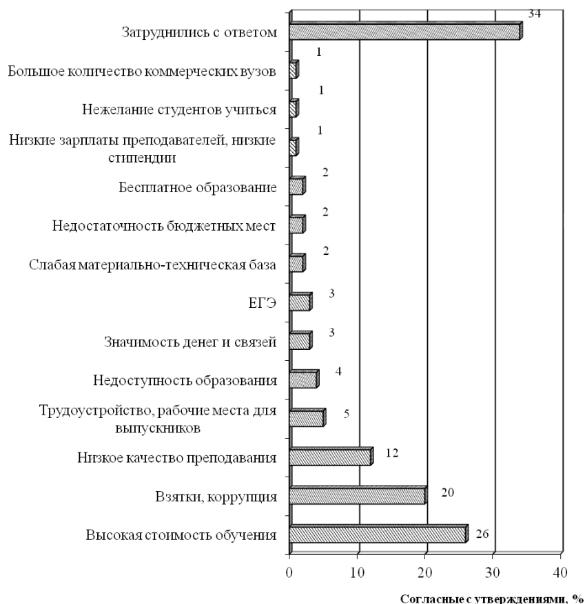
Рис. 4. Основные проблемы высшего образования в России, в %, 2011 г (диаграмма составлена автором на основе данных работы [9])

Во многом это определило высокий уровень коррупции. Взятки широко распространены как на этапе поступления в вузы, так и в процессе учебы. Такое положение дел в высшей школе влечет за собой не только моральные издержки, но и экономически дискредитирует диплом вуза, заставляя потенциального работодателя сомневаться в честности получения диплома. Снижается рыночная оценка вузовского диплома — разрыв среднего уровня зарплаты выпускников вузов и работников без высшего образования постепенно уменьшается. Это подтверждается и опросами среди населения. Так, 51 % опрошенных в рамках исследования ВЦИОМ согласны с утверждением, что «значимость высшего образования часто преувеличивают, в наше время и без него можно сделать удачную карьеру и устроить свою жизнь».